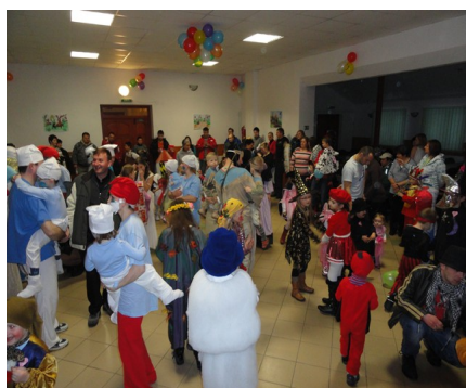
Maškarný ples v KD