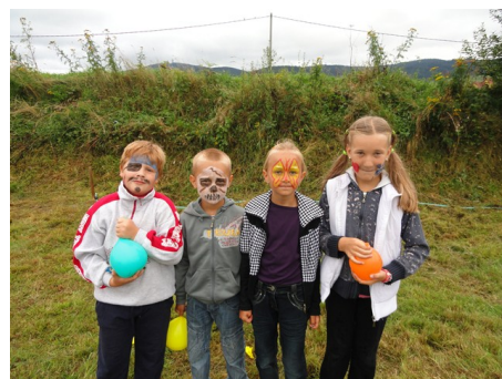
Dni obce Ťapešovo