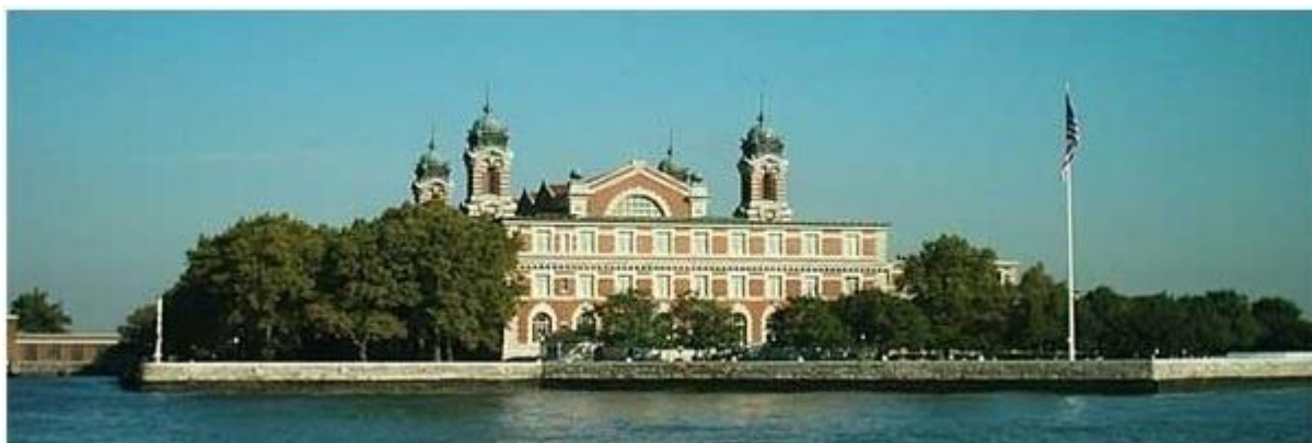
Budova Imigračného úradu dnes. V budove je múzeum prisťahovalectva „Ellis Island Immigration Museum“.