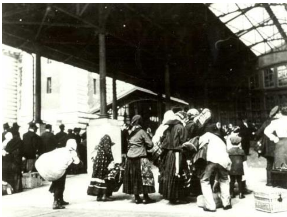
Čakanie pred vchodom do Imigračného úradu na lekársku prehliadku a vstupný pohovor s prisťahovaleckým úradníkom.

V rokoch 1820 – 1892 sídlil Imigračný úrad na juhu Manhattanu v prístave Castle Garden. Odtiaľ ho presťahovali na ostrov Ellis Island, kde v tieni Sochy Slobody postavili novú budovu z a otvorený bol 1.1.1892. Tento ostrov sa premenil na malé mesto, v ktorom sa nachádzal nový Imigračný úrad, súd, škola, nemocnica, obchody a ubytovne. Večer 17. júna 1897 budova do základov vyhorela. Okamžite začali stavať novú budovu otvorenú 17. decembra 1900 a v tento deň aj prijali 2 251 prisťahovalcov. Cez tento ostrov prešlo medzi rokmi 1892 až 1954 do Ameriky viac ako dvanásť miliónov (uvádza sa aj 17 milionov) prisťahovalcov. V novembri 1954 bol Ellis Island oficiálne uzavretý. V r. 1965 vyhlásili Ellis Island za súčasť Sochy slobody, ktorá bola postavená na susednom ostrove, za Národný pamätník. Po dôkladnej rekonštrukcii otvorili ostrov pre verejnosť a v budove Imigračného úradu zriadili múzeum „Ellis Island Immigration Museum“. Múzeum prijalo takmer 2 milióny návštevníkov ročne.