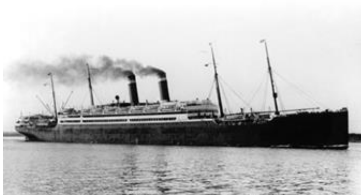
Parník „Amerika“ bol spustený na vodu v Belfaste v r. 1905. Viezol celkom 897 pasažierov, z toho 1. triedy 420, 2. triedy 254 a 3. triedy 223 pasažierov.

Aquitania /1/, Arcadia /1/, Auguste Victoria /3/, Blucher /6/, Breslau /4/, Caronia /1/, Deutschland /3/, Etruria /2/, Friesland /1/, Grosser Kurfurst /2/, Graf Waldersee /3/, H.H. Meyer /2/, Kaiser Wilhelm der Grosse /5/, Kaiser Wilhelm II /6/, Kietschon /1/, Konigin Luise /2/, Kronprinzessin Cecilie /1/, Main /1/, Moltke /3/, Neckar /3/, Patricia /4/, Pennsylvania /2/, Pretoria /2/, Rotterdam /1/, Scharnhorst /1/, Ultonia /5/, Volendam /1/.