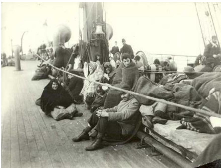
Vystáhovalci na lodi. Rok 1892.

Cestujúci 3. triedy boli umiestnení v podpalubí, v malých izbách ležali ľudia na regáloch na jednoduchom slamníku, spolu muži, ženy aj deti. Strava bola minimálna, väčšinou sa museli stravovať zo svojich zásob. Pitná voda sa rozdávala na prídel len v časových intervaloch, alebo len raz do dňa. Hygiena bola nedostatočná, vzduchu v izbe málo, mnohých premáhala morská nemoc.